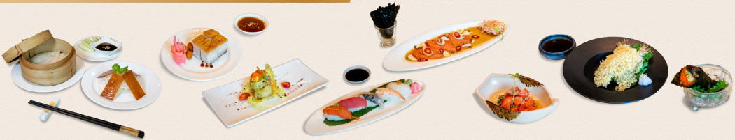
เป็ดปักกิ่ง (1 จาน) Peking duck | หมูกรอบ Crispy pork | กุ้งวาซาบิ Wasabi prawns | ซูชิรวม Assorted sushi | แซลมอนตองซีอิ้ว Salmon Otsuke Mono | ยำแซลมอนซีฟู้ด Spicy fresh salmon salad | เตมปุระกุ้ง Shrimp tempura | เอนากิปลาไหล Unagi Temaki

ชาจีนและเก๊กชวย Chinese tea and chrysanthemum tea